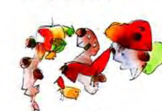
Übersetzt von Alice Jansath

W as jetzt weit in der Ferne ist, sind unsere Eltern. Ich beobachtete sie bei ihren mir unverständlichen Beschäftigungen und Projekten. Jeder stand früh auf, wenn es für ihn an der Zeit war für das, was er beschlossen hatte. Sie redeten wenig, aßen wenig, einen Käsest oder ein Stück Schokolade, die einen stets in Bewegung in Wiesen und Wäldern, die anderen verließen kaum den schattigen Türrahmen oder das rötliche Licht ihrer Laterne. Und die Äpfel, die die einen mitbrachten, ließen die anderen in Stücke geschnitten auf dem Dachboden trocknen.